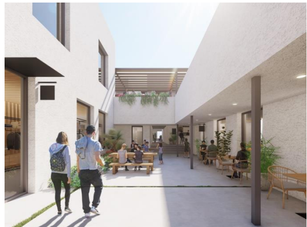
屋外通路（イメージ）