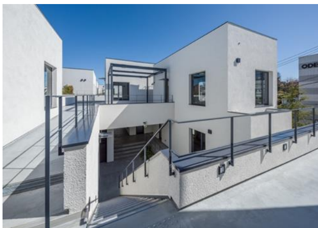
2F 下北沢駅側からみる建物外観

当社は、「reload」が地域や住民、来街者の繋がりを生み出せる新たな交流拠点として位置付け、下北線路街の新たなシンボルとなることを目指しています。「reload」という名前には、下北沢の地域に根付いた人、店、文化を大切に守りながらも、新たな文化を創る個性溢れるテナントの誘致や、都度表情を変えていくイベントスペースを掛け合わせることで、完成することなく変わり続ける場として新たな歴史を創っていくという意味を込めています。