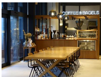
「SIDEWALK COFFEE ROASTERS」