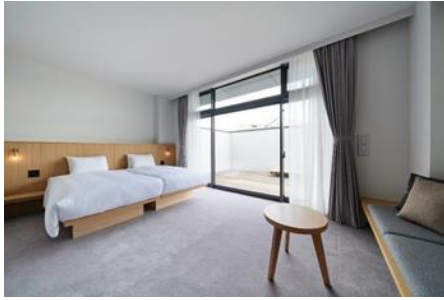
マスターデラックスの室内 (33 m 2 )