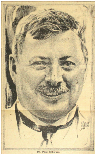
Paul Schwarz (1882–1951) verspricht, russische Ölförderanlagen sprengen zu können. Das Bild zeigt ihn 1931 als Konsul in den USA.

Wenige Tage, nachdem er dort angekommen ist, beginnen die türkischen Truppen eine Offensive auf die russische Festung Kars. Paul Schwarz wird am 20. Dezember 1914 in das türkische Hauptquartier in Köprüküy gebeten, die 60 Kilometer dorthin sind mit dem Pferdewagen eine Tagesreise. Er übernimmt Depeschen für Konstantinopel und kehrt zurück nach Erzurum, nur um dort zu erfahren, dass Telegramme des deutschen Botschafters vorliegen, die wiederum nach Köprüküy gebracht werden sollen. Von dem Hin und Her sind die Zugpferde erschöpft, das Gepäck wird auf einen Sanitätswagen umgeladen, das meiste, darunter sein Pelzmantel, Decken, ein Fernglas, wird Schwarz nie wiedersehen. Er selbst reitet auf einem russischen Beutepferd über schwierige, vereiste Wege weiter, begleitet von einem türkischen Unteroffizier. Die ungewohnten Strapazen ermüden ihn, an ein Weiterreiten ist nicht zu denken. Erst am 24. Dezember erreicht er den kleinen Ort Narman, das Hauptquartier hat man aber schon woandershin verlegt. Das Dorf ist von den zurückweichenden russischen Truppen fast ganz niedergebrannt worden, die Bewohner sind geflohen. Heizmaterial, Licht, Nahrung und ein Nachtlager lassen sich nur schwer auftreiben, ein gedeckter Unterstand muss für die Nachtruhe reichen. Das Lagerfeuer weckt ihn aus dem kurzen Schlaf, da es völlig außer Kontrolle geraten ist. Es nimmt ihm alles, was er nicht am Leib trägt.