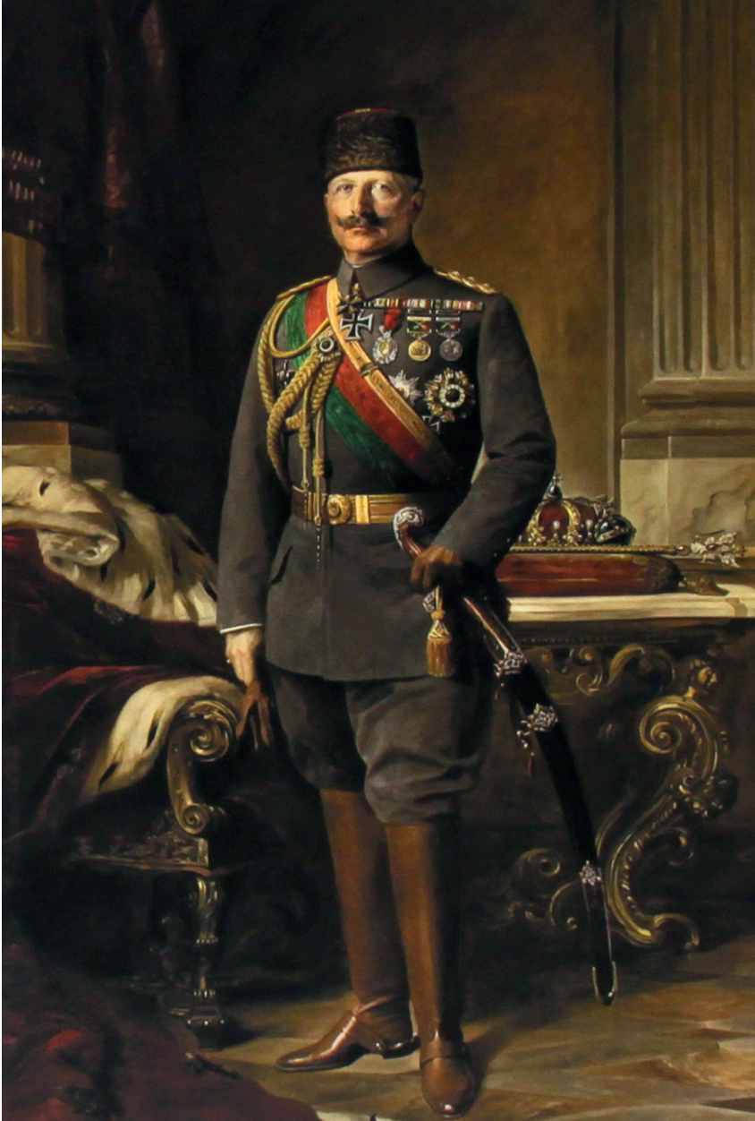
Der deutsche Kaiser Wilhelm II. in einer osmanischen Uniform (Ölgemälde aus dem Jahr 1916 von Max Fleck im deutschen Generalkonsulat in Istanbul).