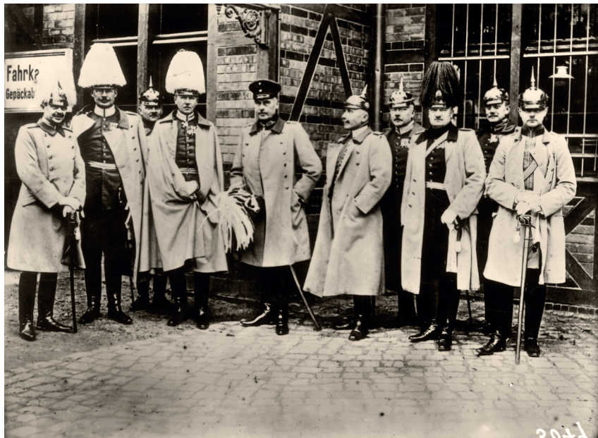
Auf Bitten der osmanischen Regierung kam im Dezember 1913 eine deutsche Militärmission unter Leitung von General Otto Liman von Sanders nach Konstantinopel.