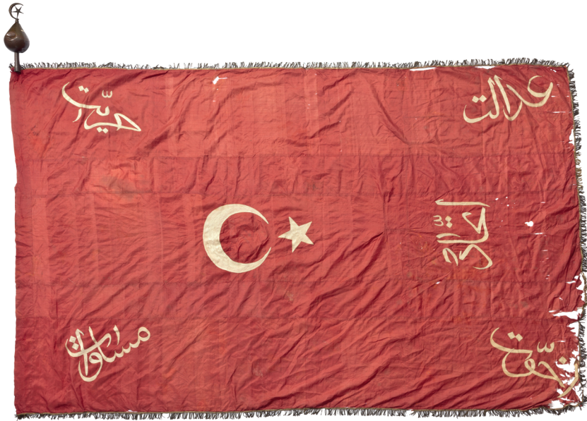
Fahne der »Jungtürken«. Die nationalistische Bewegung von Offizieren und Politikern putschte sich 1913 in Konstantinopel an die Macht.

wahren. Indem sie lange Zeit keiner Großmacht einen einseitigen wirtschaftlichen oder politischen Vorteil einräumten, sicherten sie den Fortbestand des Mächtegleichgewichts. Das war keine geringe Leistung in unruhigen Zeiten, änderte aber nichts daran, dass sich das Osmanische Reich nicht in Gänze zusammenhalten ließ. Die strategische Überdehnung des Imperiums war zuletzt mehr als augenfällig, an seinen Rändern franste es zusehends aus. In Tunesien und Ägypten hatten Frankreich und Großbritannien ihre imperialistische Chance schon genutzt und ihrem Kolonialreich diese Territorien hinzugefügt. Ihnen schloss sich Italien an, das 1911/1912 die Provinz Tripolis (Libyen) annektierte.