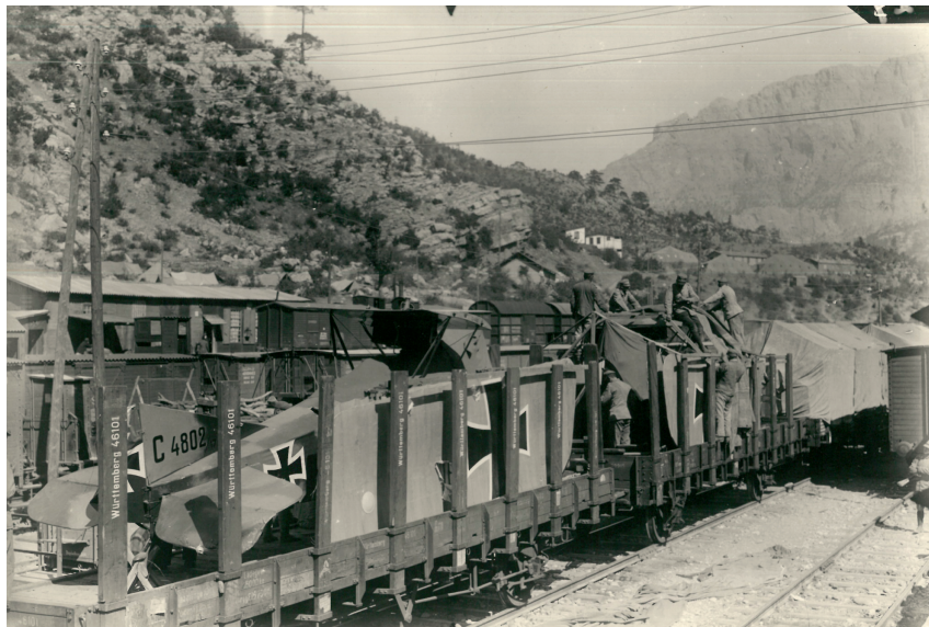
Deutsche Flugzeugteile im Taurusgebirge: Die Bagdadbahn war das wichtigste Projekt des Deutschen Reichs in der Türkei.

ren man weitgehend beibehalten hatte, seit etwa 1906 zu einem rentablen Unternehmen.