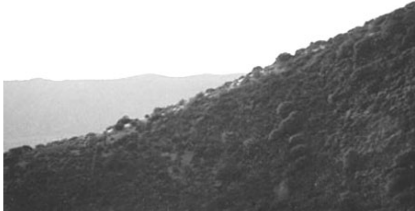
Figura 1. Pucará de Chena. Foto del punto preciso de puesta de sol del solsticio de invierno; se encuentra en la intersección de dos horizontes (marcador natural) y sobre una cumbre alta (simbolismo andino).

Curiosamente, la puesta del sol se puede observar igualmente en la intersección de los dos horizontes desde las dos puertas de acceso en los dos muros perimetrales del pucará ( Figura 2 ), sugiriendo así que distintos grupos de personas, probablemente según su rango social, podían realizar la observación del solsticio en forma similar a las prácticas en la Isla del Sol.