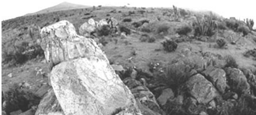
Figura 5. Valle del Encanto. Posible plaza ceremonial con petroglifo en primer plano y cerro occidental marcador del solsticio en el fondo (fotografía del 21 de diciembre 1998).

La piedra levantada está grabada en su costado superior norte por un precioso petroglifo doble (grabado profundo) representando una especie de disco con ramificaciones (¿sol?) y una especie de pájaro (¿hombre con alas o shaman?). Coincidentemente, las dos cumbres más altas del horizonte se encuentran respectivamente casi hacia el sur y hacia el norte. El horizonte está perfectamente plano desde el norte hacia el suroeste, donde un cerro cercano pone fin al desplazamiento sureño de la puesta del sol precisamente en el día del solsticio de verano, constituyendo un hito clave para un calendario de horizonte. Esas características son típicas de un paisaje sagrado. Finalmente, detallamos una observación adicional: el eje de la piedra levantada mirando hacia el sur y su inclinación de unos 30^\circ sobre el horizonte, hacen que esta roca apunte hacia el polo celeste, punto del cielo nocturno alrededor del cual gira la entera bóveda celeste. En varias culturas del mundo, este punto único era conocido y formaba el eje cósmico que une el entorno terrestre (humano) al mundo celeste (divino).