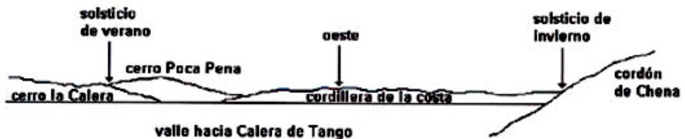
Figura 3. Pucará de Chena : horizonte occidental.

El amanecer del solsticio de verano (Figura 3) sucede también en la intersección de dos horizontes (a pesar que el efecto no es tan dramático como el caso anterior): el cerro La Calera (928 msnm) al sur de Calera de Tango y, al sur de Talagante, la parte occidental del cordón de Yervas Buenas (cerro Poca Pena, 1.242 msnm). La importancia del solsticio de Junio sobre el de Diciembre en el valle central de Chile se explica por el hecho que indica el inicio de la estación de las lluvias.