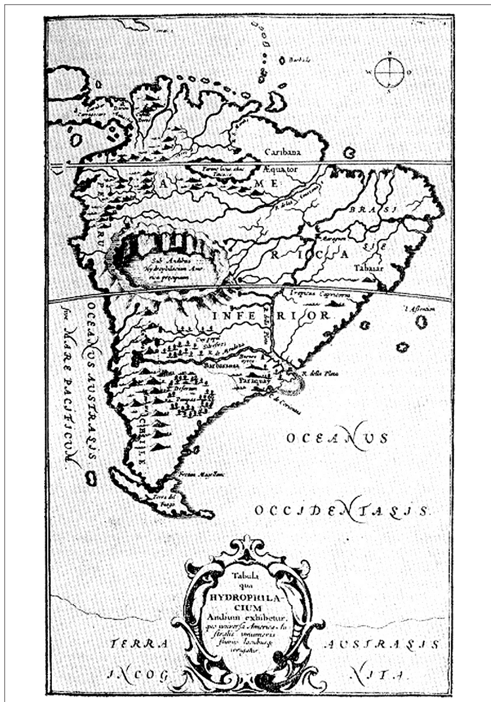
Figura 4. Hidrofilacios andinos y las grandes lagunas superficiales (Athanasius Kirker, Mundus Subterraneus , 1665)