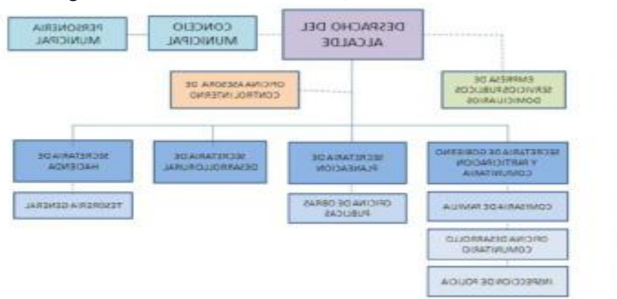
Figura 2. Estructura administrativa, San Sebastián-Cauca