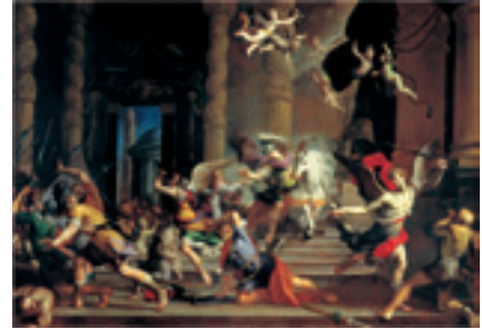
Orazio Talmi, Cacciata di Eliodoro dal tempio