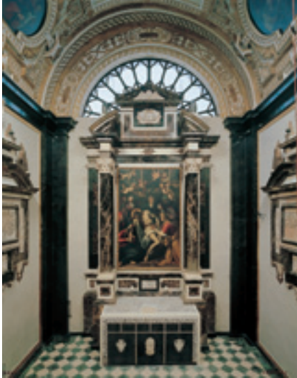
cappella Ruggeri Brami