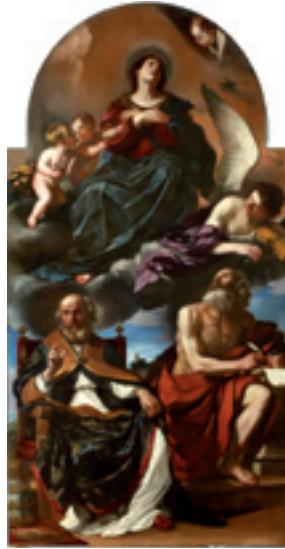
Guercino, Assunta e santi Girolamo e Pietro