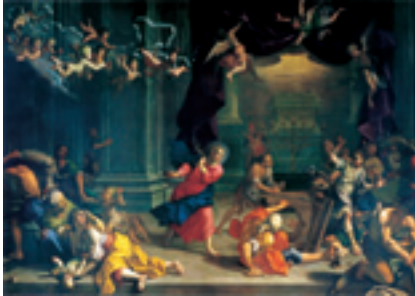
Orazio Talmi, Cacciata dei mercanti dal tempio