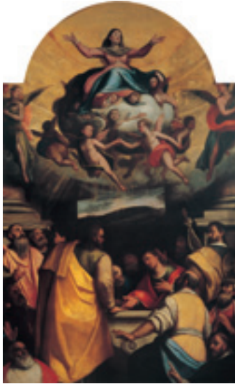
Federico Zuccari, Assunzione della Vergine