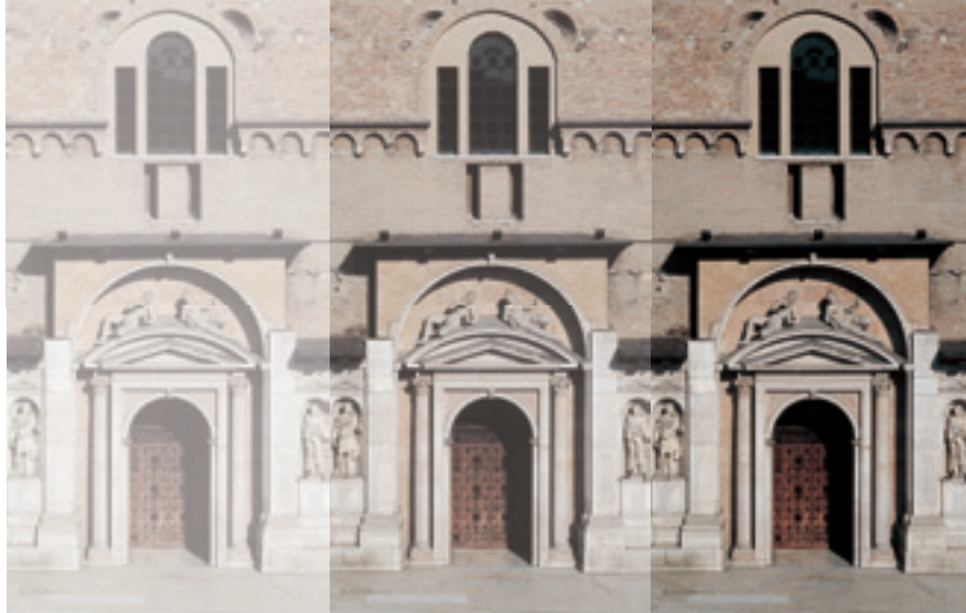
la cattedrale di reggio emilia