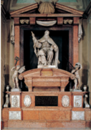
Prospero Sogari, detto il Clemente, Monumento funebre al vescovo Rangone