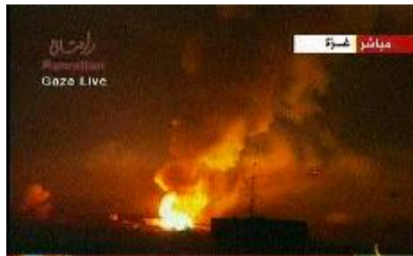
פיצוץ מסוף גז בשכונת אלזייתון בעזה, במהלך הפעולה הקרקעית (אלג'זירה, 3 בינואר).