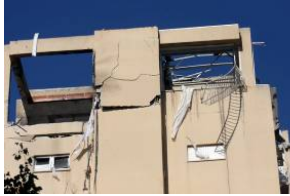
רקטה שפגעה ישירות בבית באשדוד ב- 1 בינואר (Sderot Media Center, 1 בינואר. צילום: רועי עידן).

2. מאז תחילת המבצע הקרקעי (3 בינואר 1900) נפלו במהלך ליל 3-4 בינואר ארבע רקטות מהן אחת באשדוד, ותשע פצצות מרגמה. כמו כן נורו מספר פצצות מרגמה לעבר כוח צה"ל, שפעל במסגרת המבצע סמוך למחנה הפליטים ג'באליא. כתוצאה מהירי נפצעו 17 חיילים שניים מהם באורח קשה. בבוקר 4 בינואר נפלו כמה רקטות בשטח ישראל. אחת הרקטות נפלה באשדוד ופגעה בחנות. רקטה נוספת פגעה פגיעה ישירה בבית בשדרות. כמה רקטות נפלו באשקלון ובתחומי המועצה האזורית אשכול ושער הנגב.