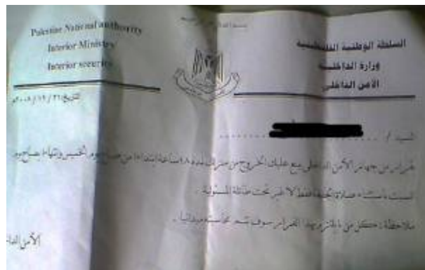
ההודעה ששלחה חמאס ברצועה לאנשי פתח (פאל פרס, 2 בינואר)

11. חמאס ממשיכה להטיל אימה על תושבי הרצועה, ולדכא את פעילי פתח, גם בעת מבצע "עופרת יצוקה". אתר פאל פרס (המזוהה עם פתח), דיווח כי פעילי חמאס שלחו צווי איסור יציאה מהבתים למאות אנשי פתח ברצועה, אשר הורשו לצאת לתפילות יום השישי בלבד. על פי הדיווח עשרות אנשי פתח שעברו על האיסור נורו ברגליהם על ידי פעילי חמאס ברחבי הרצועה (פאל פרס, 2 בינואר).