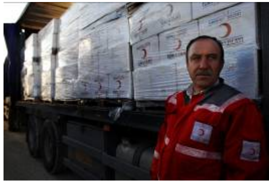
מימין: העברת סיוע מתורכיה לרצועת עזה דרך מעבר כרם שלום (דובר צה"ל, 2 בינואר). משמאל: משלחת סיוע מסוריה בדרכה לירדן (אלג'זירה, 3 בינואר).