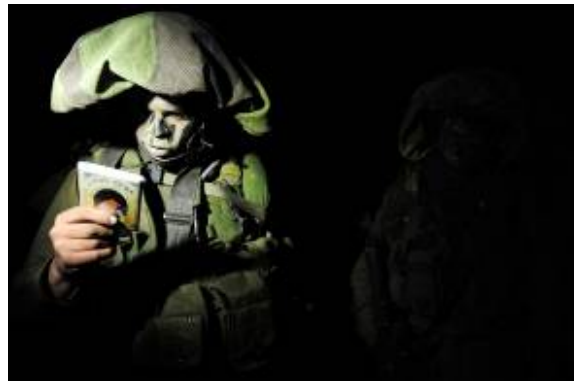
הכנות אחרונות לקראת כניסה קרקעית לרצועה (דובר צה"ל, 3 בינואר)