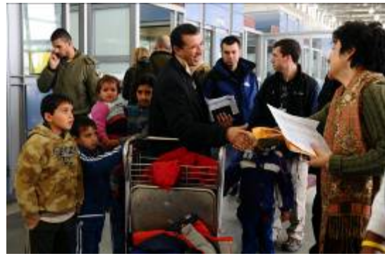
מימין: יציאת אזרחים זרים מרצועת עזה (דובר צה"ל, 2 בינואר). משמאל: העברת סיוע הומאניטארי במעבר כרם שלום (דובר צה"ל, 2 בינואר).