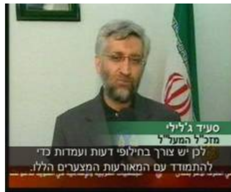
מזכיר המועצה הלאומית, גילילי (אלג'זירה, 2 ו-3 בינואר)