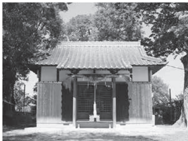
2人の帰り道にある神社【日方高木明神社】