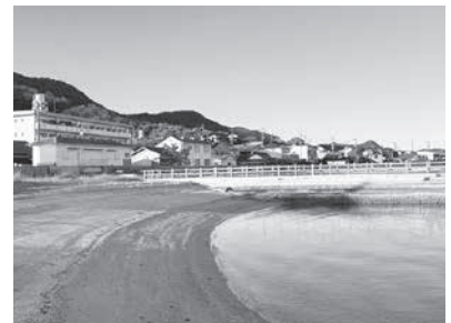
2人が音楽を聴く堤防【オリーブビーチ】

※ロケ地を訪れるときは、車は公共の駐車場に止め、私有地に立ち入って写真を撮るなど、周辺の方に迷惑となる行動はやめましょう。皆様のご協力をお願いします。