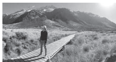
第2の故郷ニュージーランドにて

日本語特有の発音などが影響するものの、実は「理解しやすい英語を話す人たち」とも言われています。久しぶりのNZは、「英語は、母国語とする人たちだけのものではなく、誰もがコミュニケーションに使う言語である」ということを思い出させてくれました。皆さんも、発音や文法などにとらわれず、少しの英語やその他の外国語、そして心のこもった日本語を使って、小豆島に来る海外からの観光客と堂々とコミュニケーションを楽しんでくださいね。