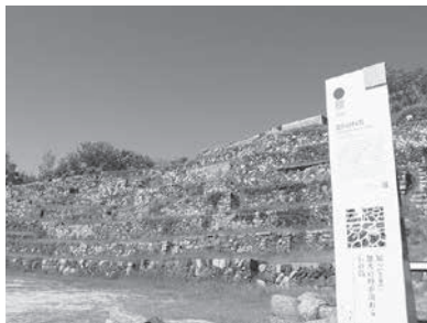
高木さんと西片が花火を眺めた場所【池田の棧敷】