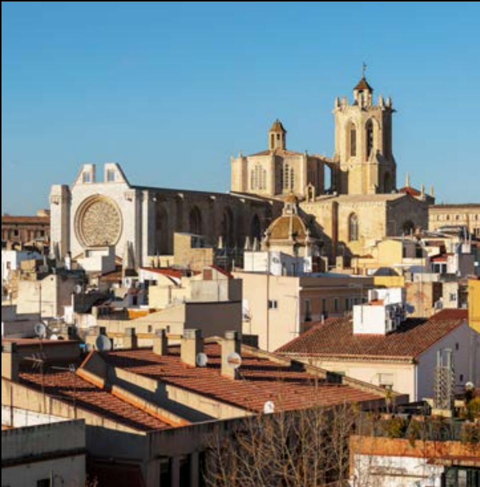
La cathédrale vue du prétoire romain