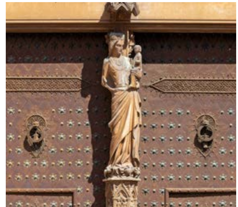
La Vierge du trumeau