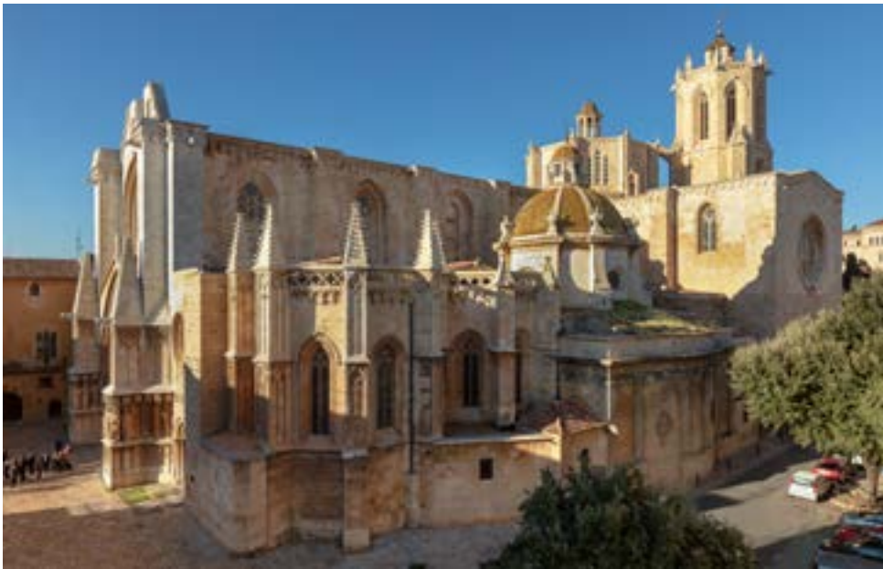
Vue panoramique de la cathédrale