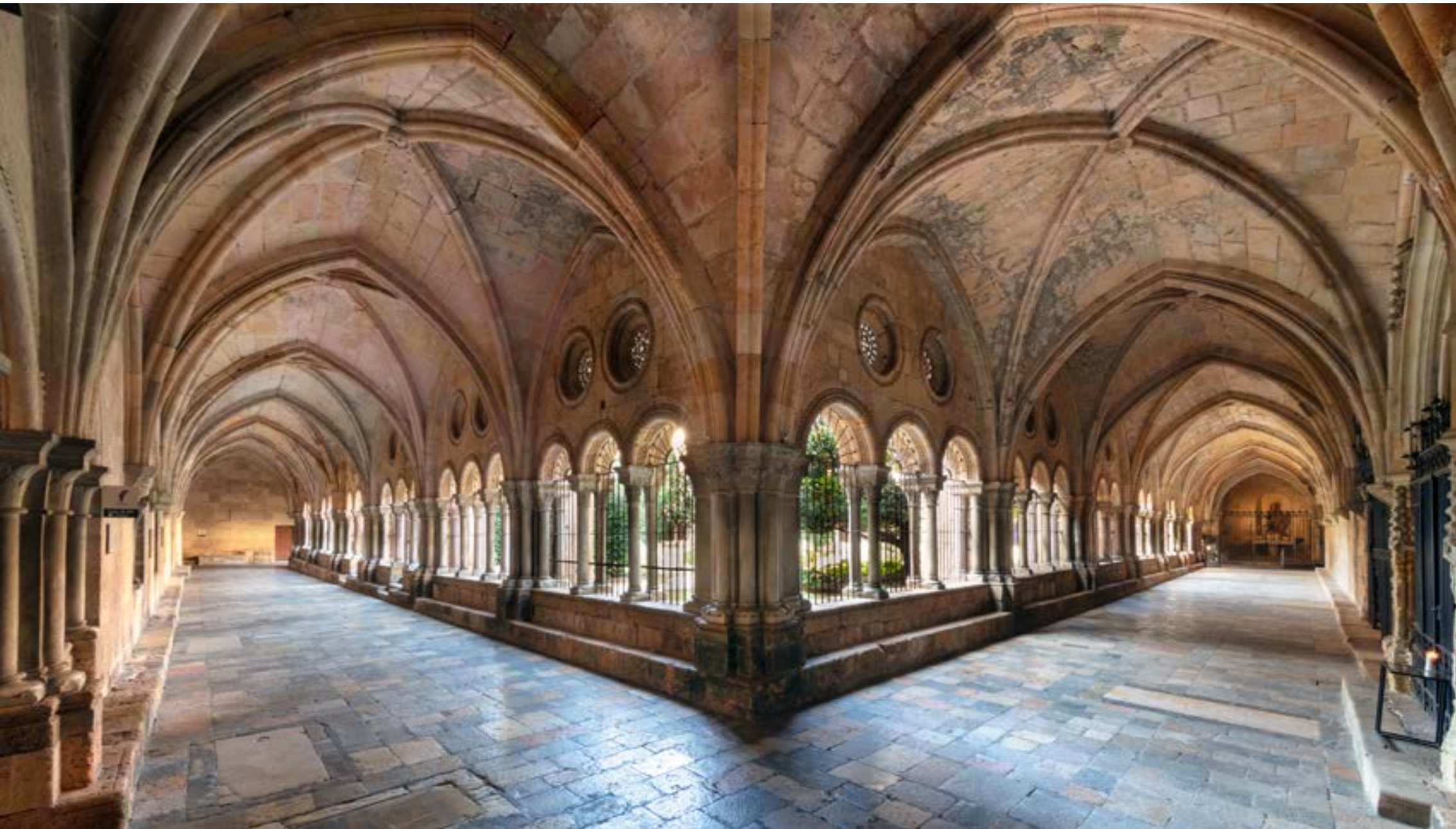
Galleries du cloître