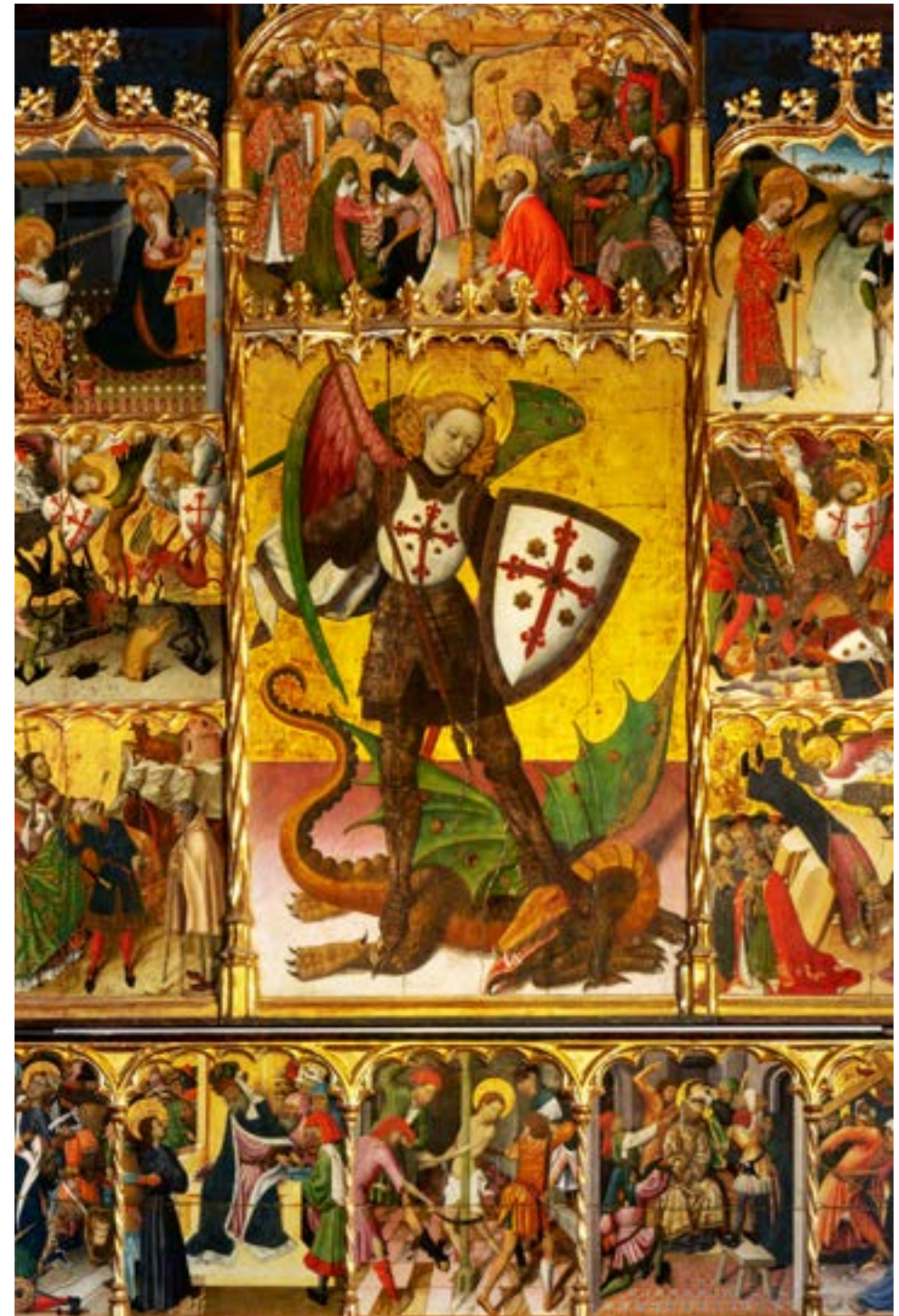
→ Retable de saint Michel

Une grille en fer forgé ferme la chapelle. Les fleurons de son couronnement font alterner la croix en tau du Chapitre et une pointe de lance.