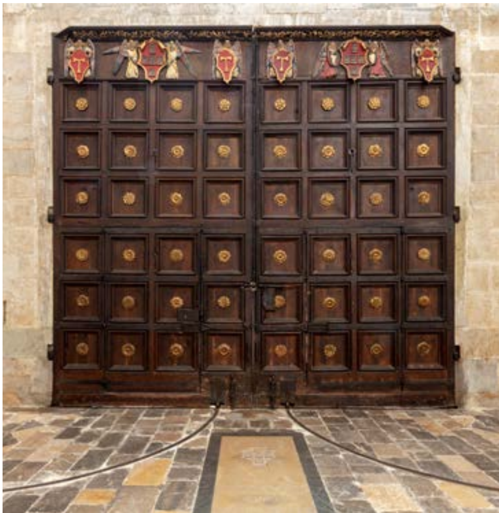
La porte principale vue de l'intérieur