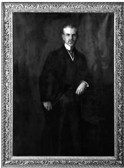
Obrázek Rudolfa Czernin-Morzina (1855–1927) od rakouského portrétisty Hermanna Torgglera ze začátku 20. století