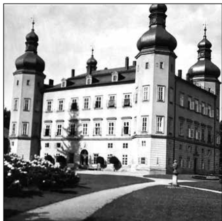
Zámek Vrchlabí v roce 1932