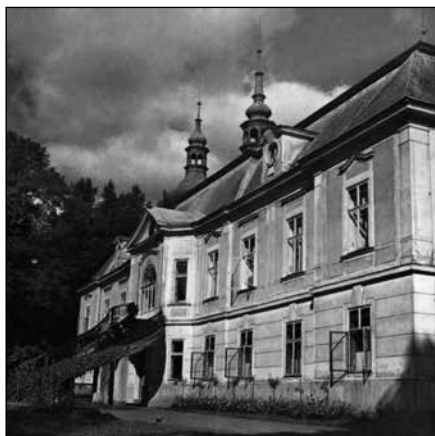
Zámek v Horním Maršově v září 1936